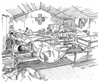
24. Finding sick people