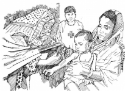
14. Vaccinations for children