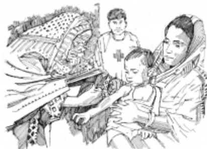
14. Vaccinations for children