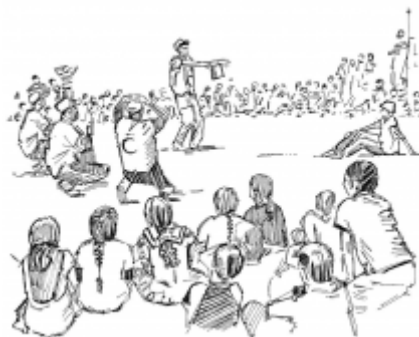
23. Encouraging healthy behaviours in a community