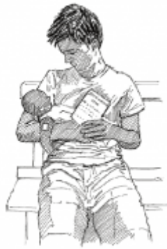
15. Using vaccination cards