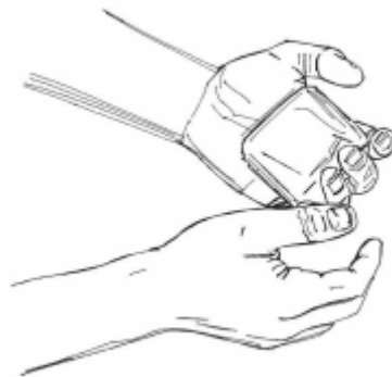
08. Washing hands with soap