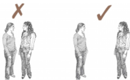
21. Physical distancing