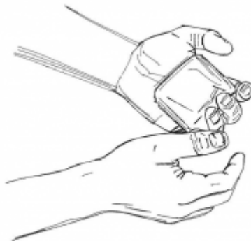
08. Washing hands with soap