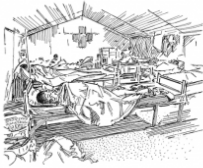
24. Finding sick people