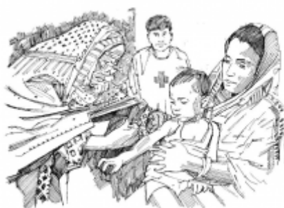
14. Vaccinations for children