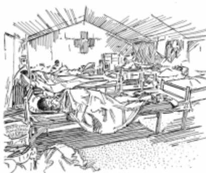
24. Finding sick people