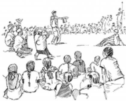
23. Encouraging healthy behaviours in a community