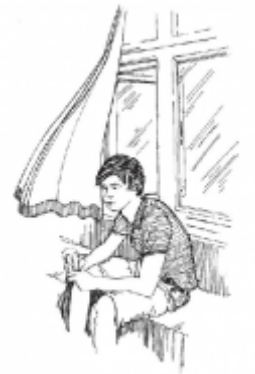
22. Good ventilation