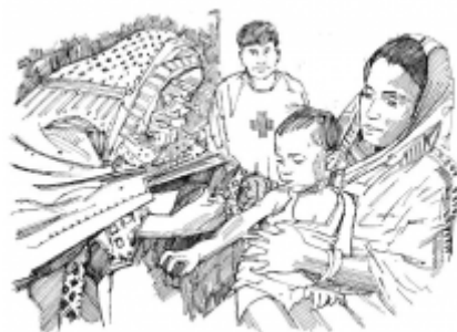
16. Attending vaccination campaigns