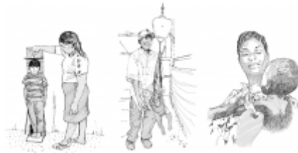
29. Attending nutrition checks