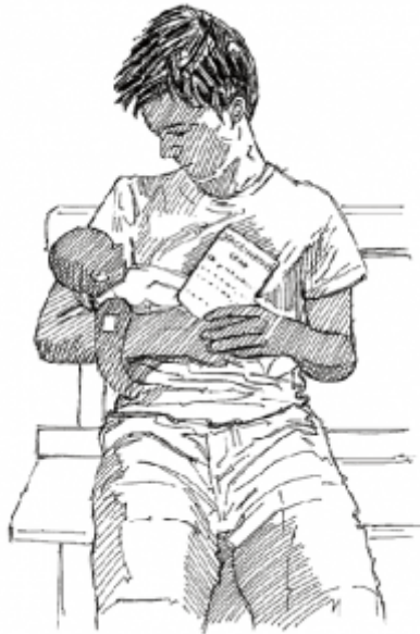
15. Использование прививочных карточек