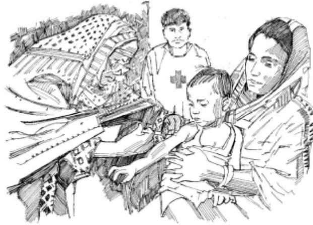
16. Участие в кампаниях по вакцинации