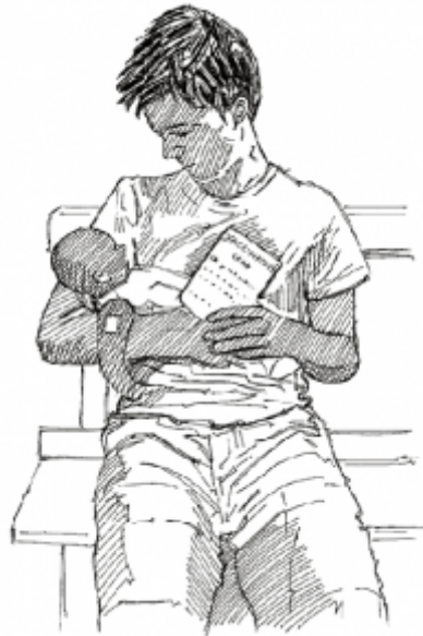
15. Использование прививочных карточек