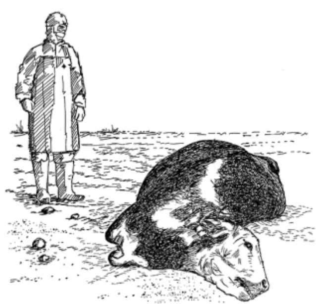
25. Содержание и забой животных