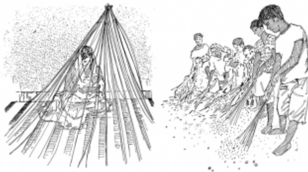
07. Защита себя от комаров