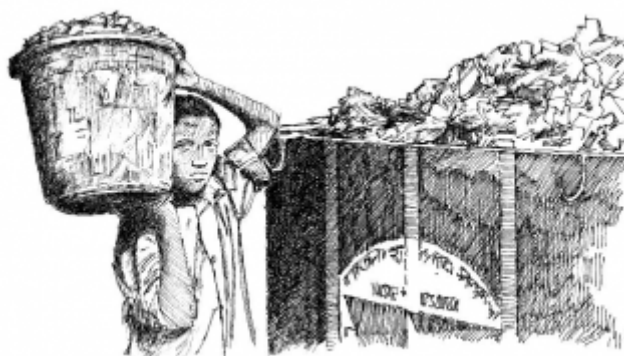
20. Сбор и вывоз мусора