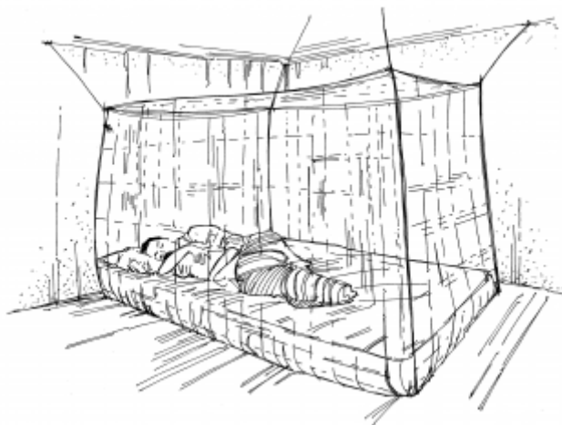
17. Использование москитных сеток во время сна