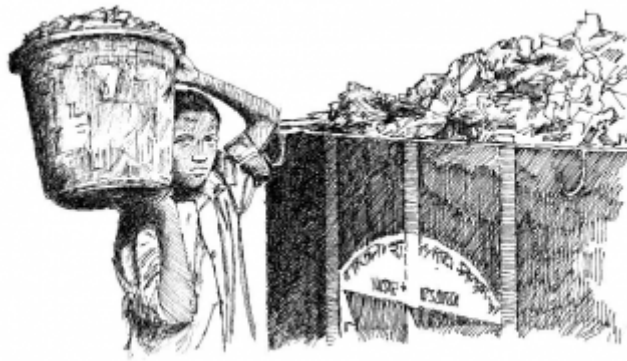
20. Сбор и вывоз мусора