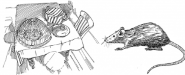
27. Защита от грызунов