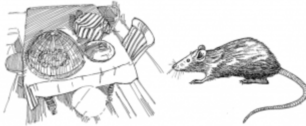
27. Защита от грызунов