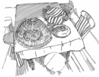
12. Надлежащая гигиена питания