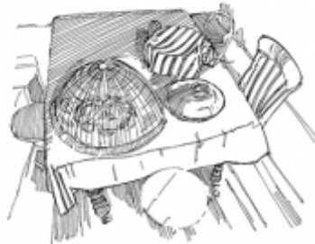
12. Надлежащая гигиена питания