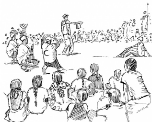
23. Поощрение здорового образа жизни в обществе