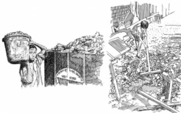
11. Уборка территорий, где могут размножаться комары