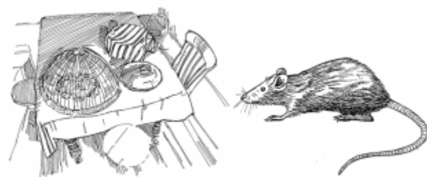
27. Защита от грызунов