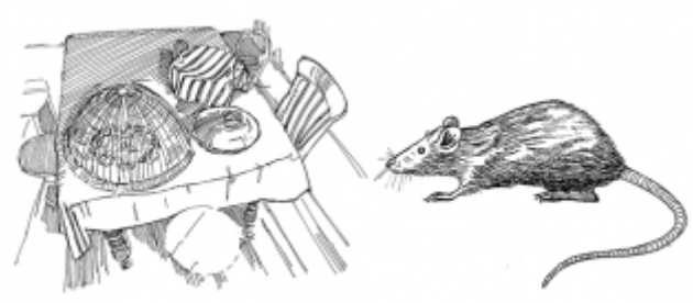
27. Защита от грызунов