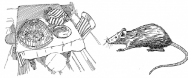
27. Keeping rodents out