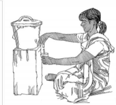
04. Правильное хранение воды