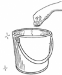
05. Использование чистой безопасной питьевой воды