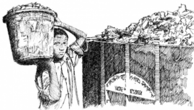
20. Сбор и вывоз мусора