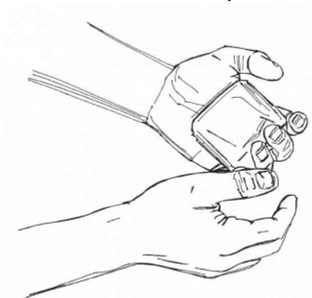
08. Мытье рук с мылом