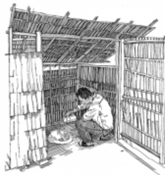
06. Использование чистых туалетов