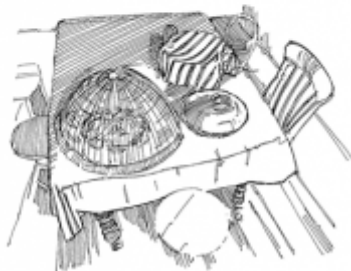
12. Надлежащая гигиена питания