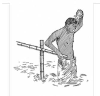
13. Надлежащая личная гигиена