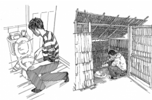
06. Использование чистых туалетов