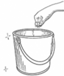
05. Использование чистой безопасной питьевой воды