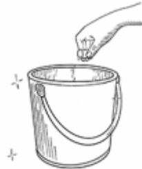
05. Использование чистой безопасной питьевой воды