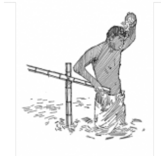
13. Надлежащая личная гигиена