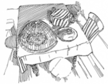
12. Надлежащая гигиена питания