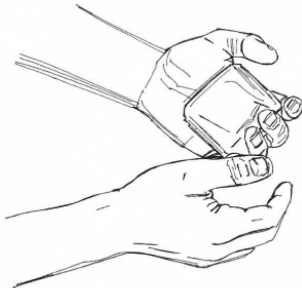
08. Lavage des mains avec du savon