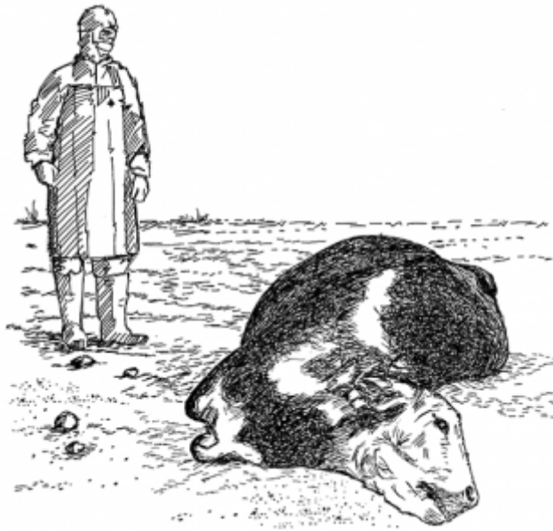
25. Prise en charge et abattage des animaux