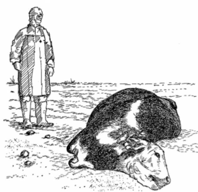
25. Prise en charge et abattage des animaux