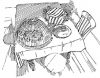
12. Bonne hygiène des aliments