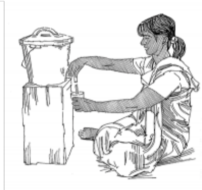
04. Conservation de l'eau