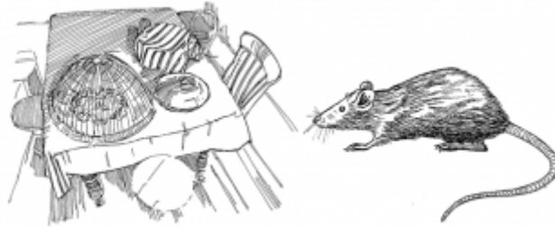
27. Éloignement des rongeurs