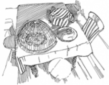
12. Bonne hygiène des aliments