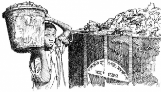
20. Collecte et élimination des déchets