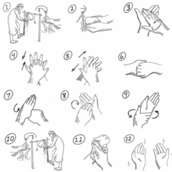
10. Étapes du lavage des mains dans les épidémies