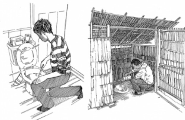
06. Utilisation de latrines propres