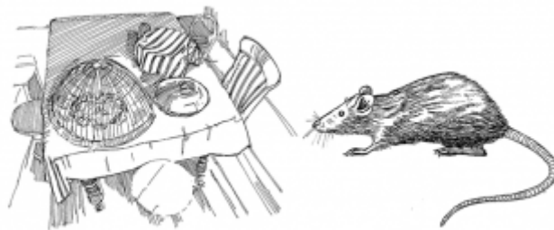
27. Éloignement des rongeurs