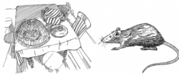
27. Éloignement des rongeurs