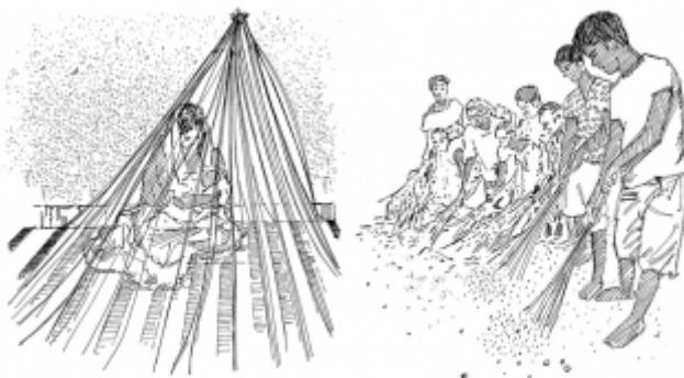
07. Protection contre les moustiques