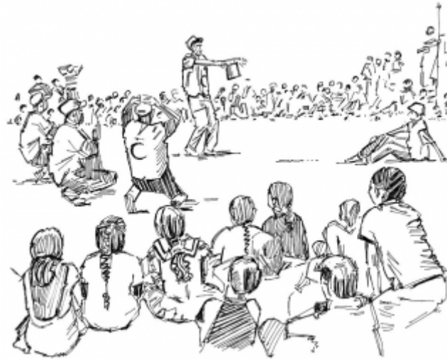
23. Promotion des comportements sains dans la communauté