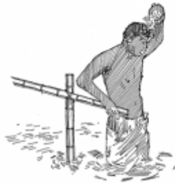
13. Bonne hygiène personnelle