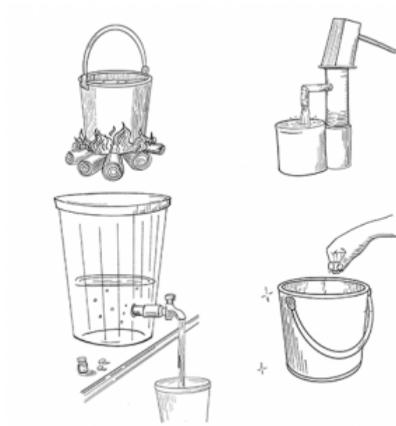
05. Consommation d'eau propre et salubre