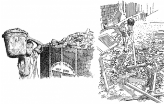
11. Nettoyage des endroits où les moustiques se reproduisent