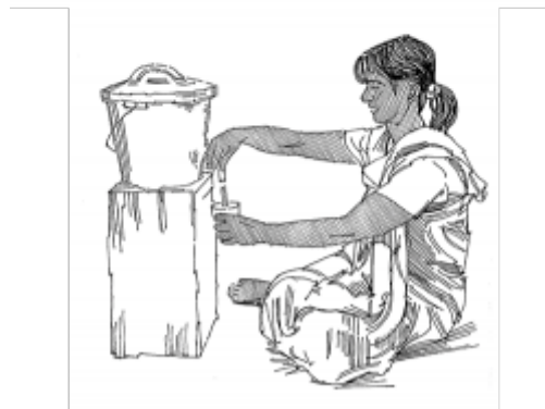
04. Conservation de l'eau