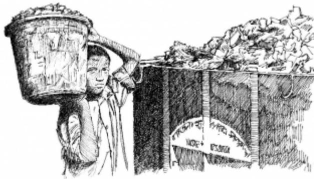
20. Collecte et élimination des déchets