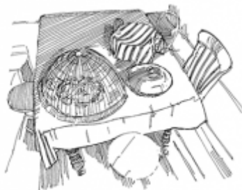
12. Bonne hygiène des aliments