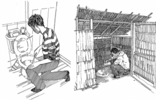
06. Utilisation de latrines propres