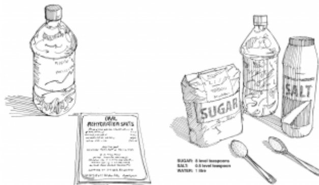
01. Préparation et administration d'une solution de