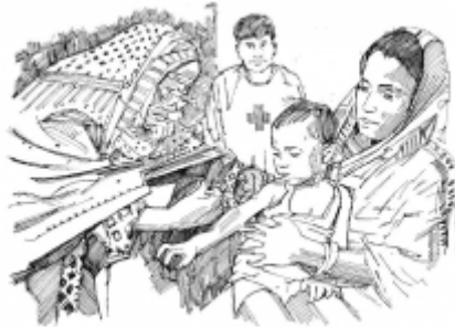
14. Vaccinations for children