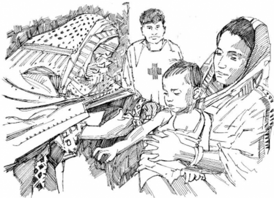
Campañas de vacunación masiva