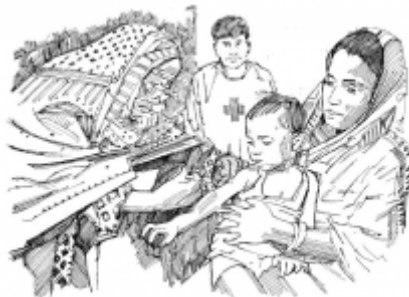
16. Attending vaccination campaigns