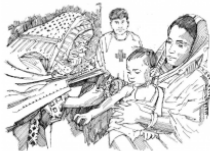
16. Attending vaccination campaigns