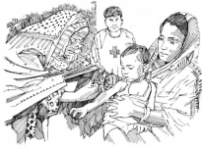
14. Vaccinations for children