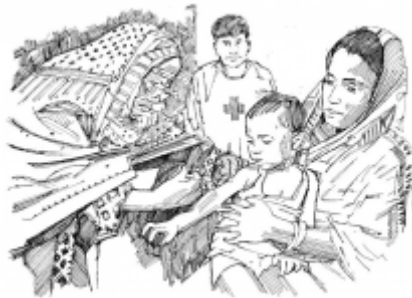
14. Vaccinations for children