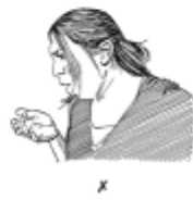
18. Coughing correctly