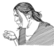
18. Coughing correctly