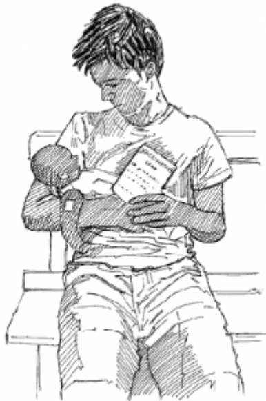
15. Usando tarjetas de vacunación