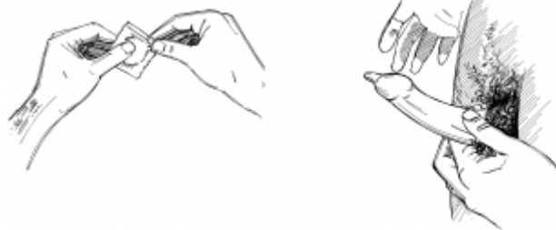
26. Practicando el sexo seguro