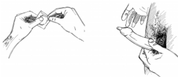
26. Practicando el sexo seguro