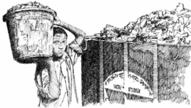
20. Recolectando y eliminando la basura