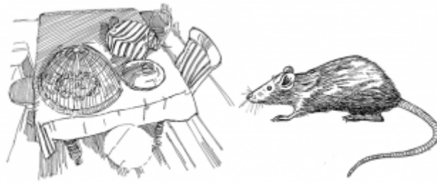
27. Manteniendo a los roedores fuera