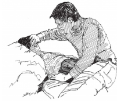
Caring for a person with fever .02