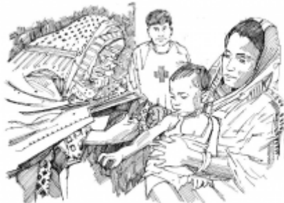
Attending vaccination campaigns .16