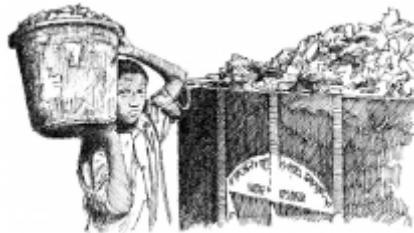
Collecting and disposing of rubbish .20