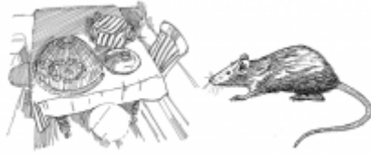
Keeping rodents out .27