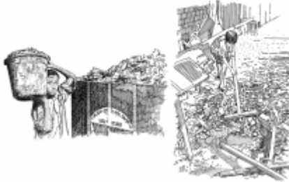
Cleaning up places where mosquitoes breed .11