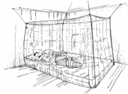
Sleeping under mosquito nets .17