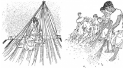
Protecting yourself against mosquitoes .07