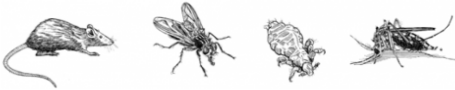
رسوم توضيحية لنواقل: بعوضة، برغوث، ذبابة، جرذ