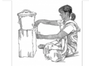
Storing water properly .04