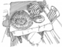
Good food hygiene .12