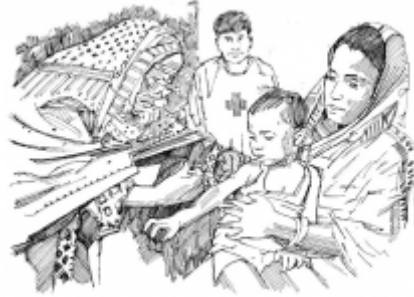
Vaccinations for children .14