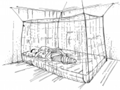
Sleeping under mosquito nets .17