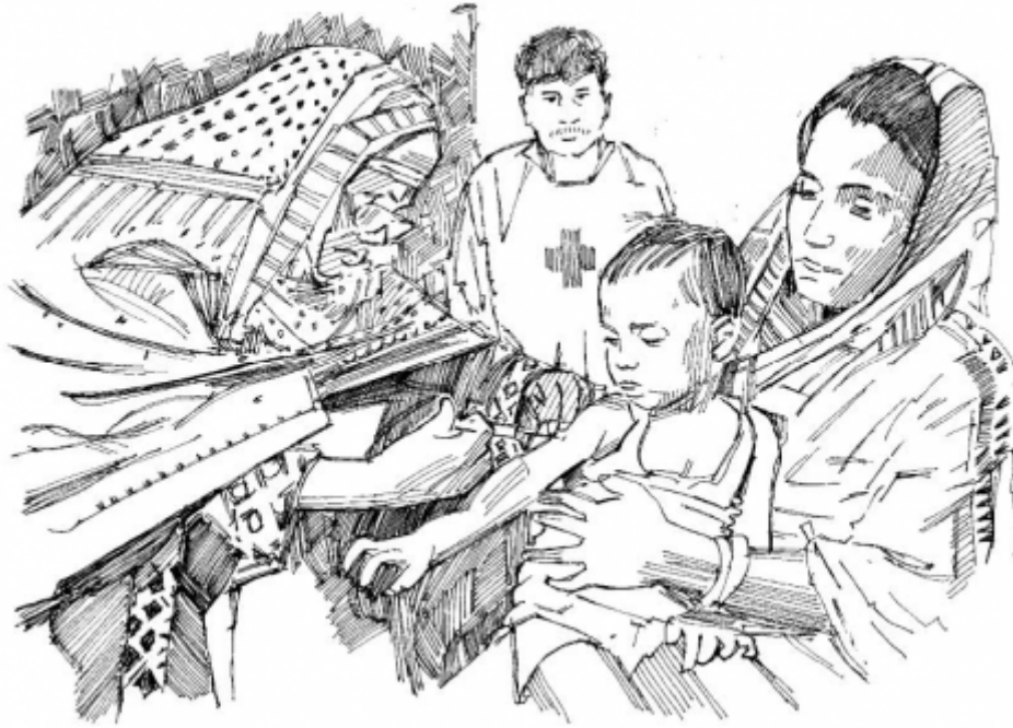
حملات التلقيح الواسعة النطاق