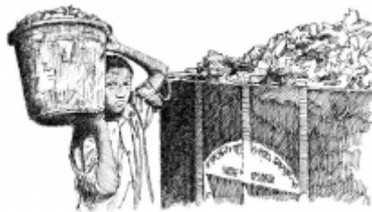
Collecting and disposing of rubbish .20