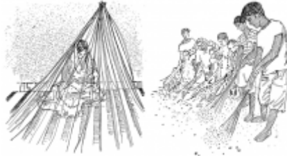
Protecting yourself against mosquitoes .07