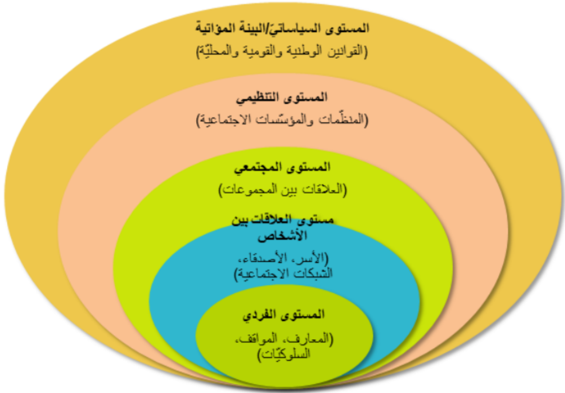
النموذج الاجتماعي والبيئي