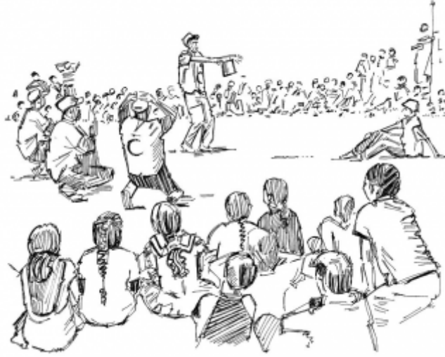
23. أمان الممارسات الجنسية