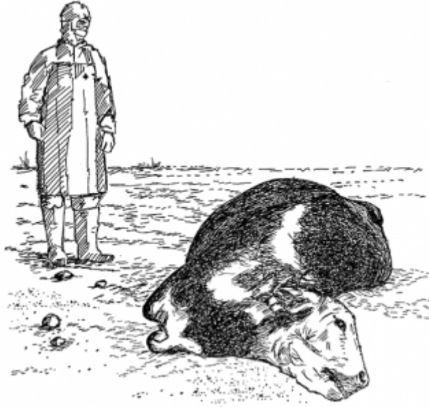
25. مناولة الماشية وذبحها