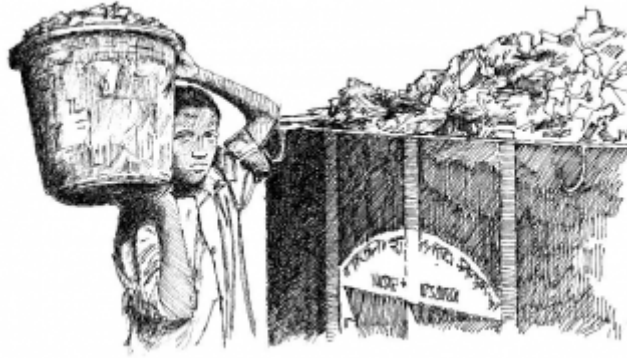
20. جمع القمامة والتخلص منها