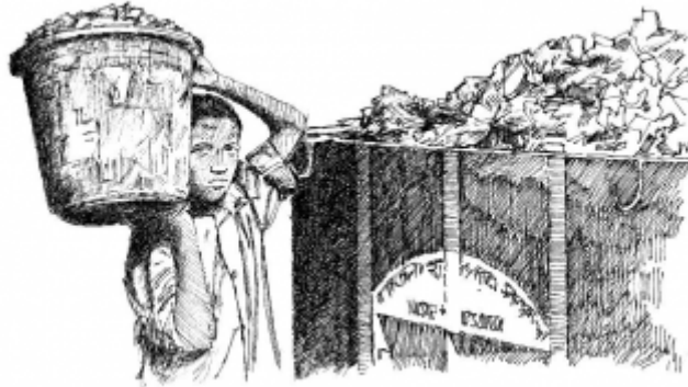
20. جمع القمامة والتخلص منها