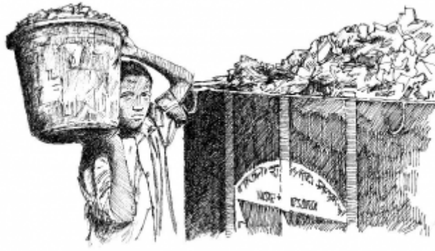
20. جمع القمامة والتخلص منها