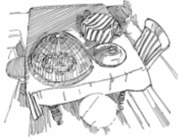
12. نظافة الأطعمة