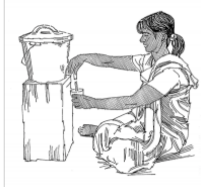
04. تخزين الماء بطريقة صحيحة