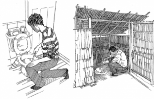
06. استخدام مرحاض نظيف