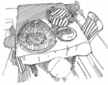
12. نظافة الأطعمة