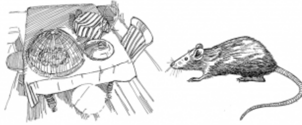
27. إبعاد القوارض