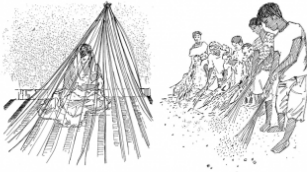
07. حماية نفسك من لدغات البعوض