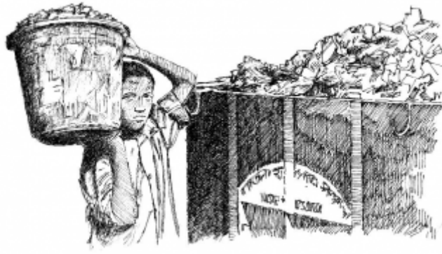
20. جمع القمامة والتخلص منها