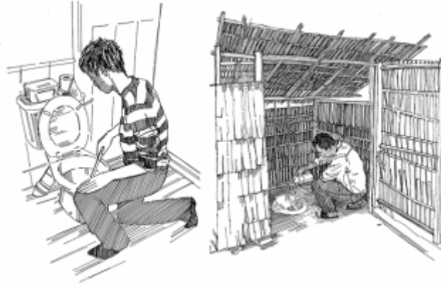
06. استخدام مرحاض نظيف