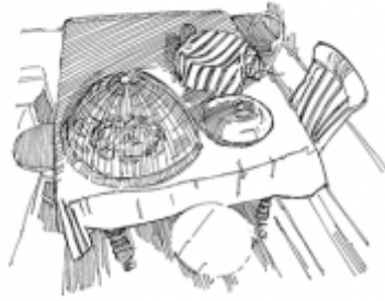
12. نظافة الأعممة