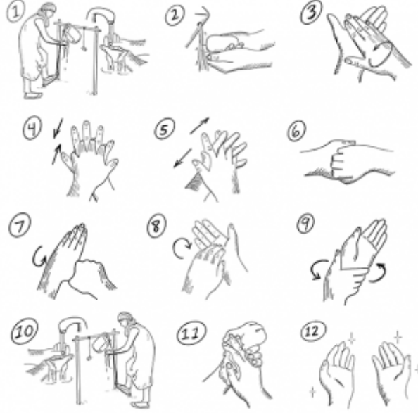
10. خطوات غسل اليدين في حالات تفشي الأوبئة