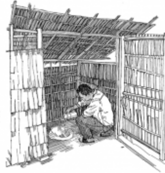
06. استخدام مرحاض نظيف