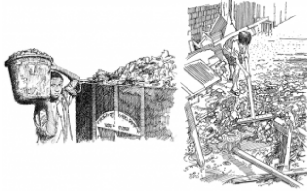
11. تنظيف أماكن تكاثر البعوض