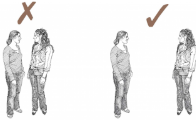
21. التباعد الاجتماعي