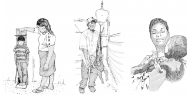
29. حضور فحوص قياس سوء التغذية