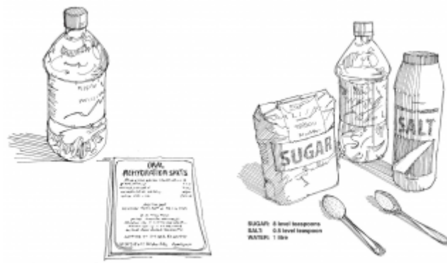
01. اعداد محلول الإمهاء الفموية وإعطاؤه