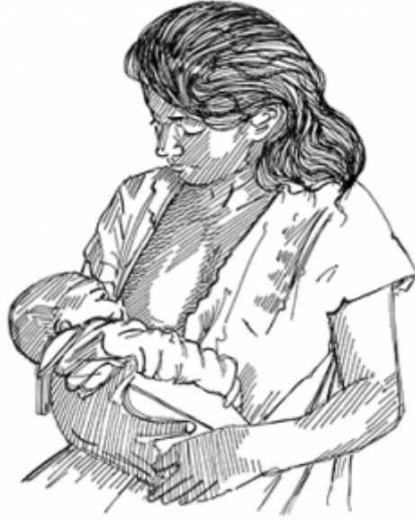
03. الرضاعة الطبيعية