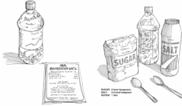
01. اعداد محلول الإمهاء الفموية وإعطائه