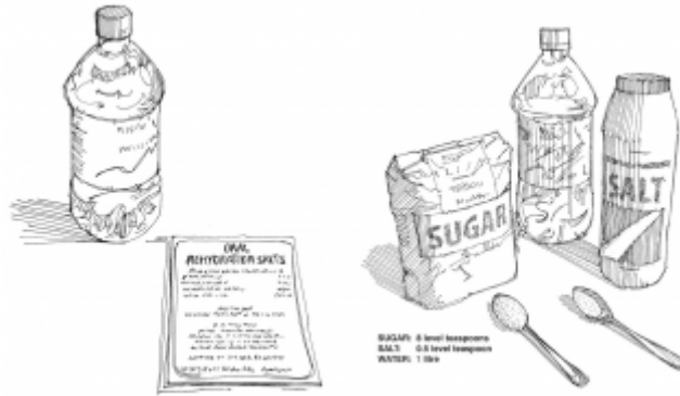
01. اعداد محلول الإمهاء الفموية وإعطاؤه