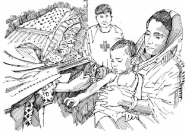
14 . تحصين الأطفال باللقاحات